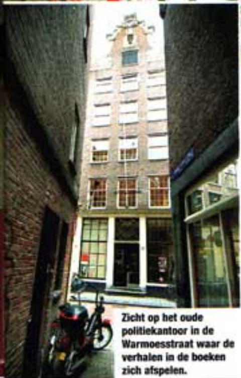
Zicht op het oude politiekantoor in de Warmoesstraat waar de verhalen in de boeken zich afspelen.

was gestationeerd in de rosse buurt maakt het allemaal nog wat smeüger, zeker als je een bevlogen verteller als Arie als gids hebt. Een wandeling over de walletjes hoort dus ook bij de toer, want daar spelen heel wat van de verhalen zich af. En natuurlijk ligt het stamcafé van De Cock ook midden in die rosse buurt. Maar om dat café te vinden zal je lang mogen zoeken! Want volgens de boeken ligt het op de hoek van de Barndesteeg en de Oudezijdsachterburgwal,