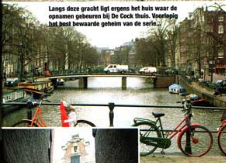
Langs deze gracht ligt ergens het huis waar de opnamen gebeuren bij De Cock thuis. Voorlopig het best bewaarde geheim van de serie...