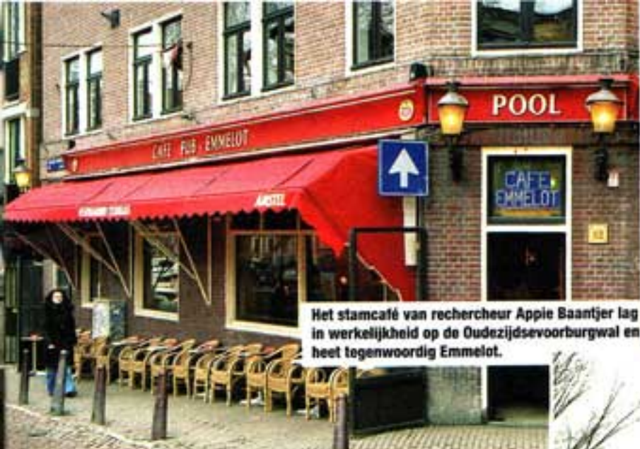
Het stamcafé van rechercheur Appie Baantjer lag in werkelijkheid op de Oudezijds Voorburgwal en heet tegenwoordig Emmelot.