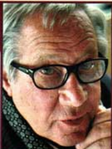
Acteur Piet Römer, beter bekend als de nukkige rechercheur De Cock uit de tv-reeks 'Baantjer'.