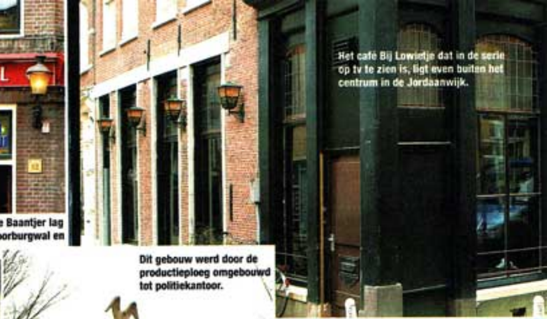
Dit gebouw werd door de productieploeg omgebouwd tot politiekantoor.